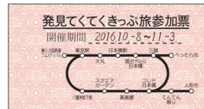
「てんでん祭」配布用