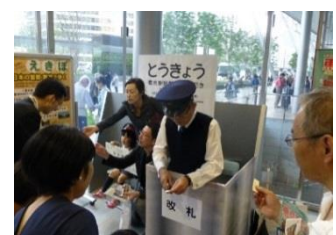
入鉄実演イベント(イメージ)

※入鉄を入れることができるのは、各拠点で配布される「記念レプリカきっぷ(硬券)」のみとなり、鉄道会社で発売のきっぷ(普通乗車券、回数券等)への入鉄は行いません。