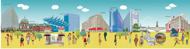
オリジナルきっぷ台紙・外面(イメージ)