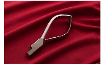
B賞:東京名産セレクション