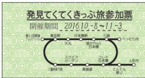
「第 23 回鉄道フェスティバル」配布用