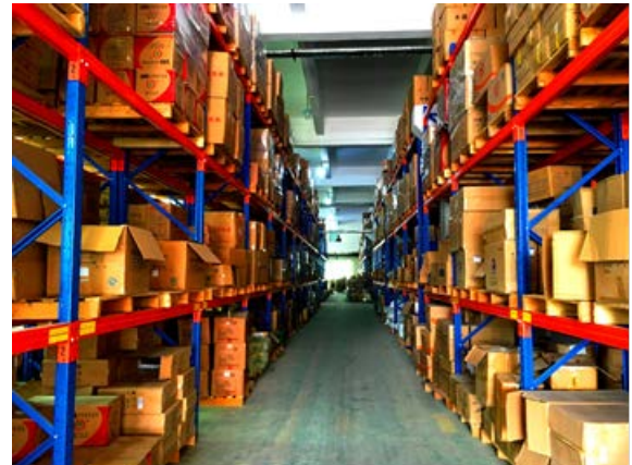
三慧物流新センターの庫内の様子