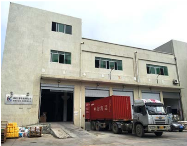
三慧物流新センター外観