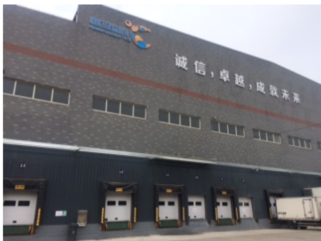
上海恒孚物流新センター外観